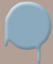
mineral blue 400 ml: 328 304 150 ml: 328 404