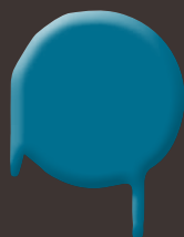
aqua breeze 400 ml: 328 333