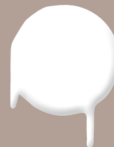
transparent 400 ml: 328 318 150 ml: 328 418