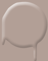
cashmere brown 400 ml: 328 305 150 ml: 328 405