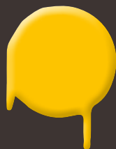
sunny boost 400 ml: 328 325