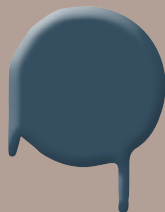
jeans blue 400 ml: 328 321 150 ml: 328 421