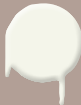
elegant white 400 ml: 328 314 150 ml: 328 414