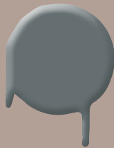
graphite grey 400 ml: 328 319 150 ml: 328 419