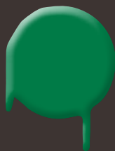
juicy green 400 ml: 328 335