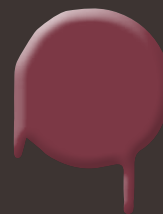
burgundy red 400 ml: 328 328