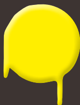
neon yellow 400 ml: 328 324