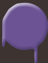
cosmic violet 400 ml: 328 331