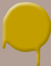
gold metal 400 ml: 328 316 150 ml: 328 416