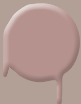
cosy velvet 400 ml: 328 308 150 ml: 328 408