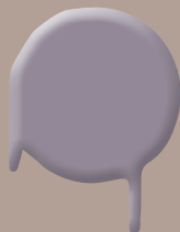
lavender flower 400 ml: 328 309 150 ml: 328 409