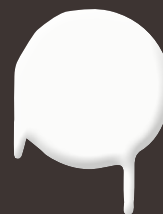
flash white 400 ml: 328 322