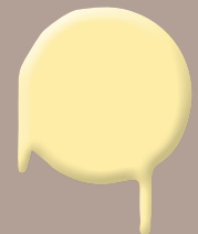
vanilla yellow 400 ml: 328 320 150 ml: 328 420