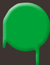
neon green 400 ml: 328 334