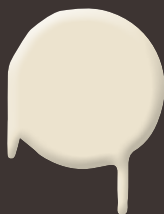
natural white 400 ml: 328 323

Die abgebildeten Farbmuster sind aus drucktechnischen Gründen nicht farbverbindlich!