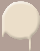
desert sand 400 ml: 328 303 150 ml: 328 403