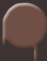
soft brown 400 ml: 328 336