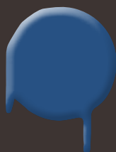
dynamic blue 400 ml: 328 332