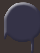
black violet 400 ml: 328 337