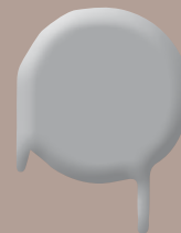
silver metal 400 ml: 328 315 150 ml: 328 415