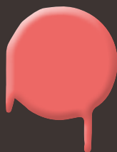
neon orange 400 ml: 328 326