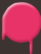
neon pink 400 ml: 328 329