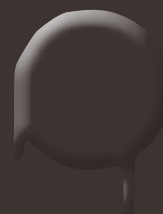
dark chocolate 400 ml: 328 338