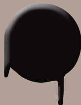
deep black 400 ml: 328 313 150 ml: 328 413