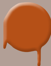
copper metal 400 ml: 328 317 150 ml: 328 417