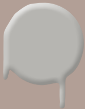
moon grey 400 ml: 328 301 150 ml: 328 401

Die abgebildeten Farbmuster sind aus drucktechnischen Gründen nicht farbverbindlich!