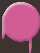
moody magenta 400 ml: 328 330