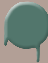
forest green 400 ml: 328 312 150 ml: 328 412