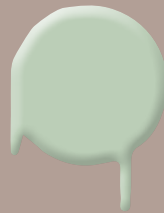
jade green 400 ml: 328 311 150 ml: 328 411