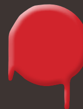
energetic red 400 ml: 328 327